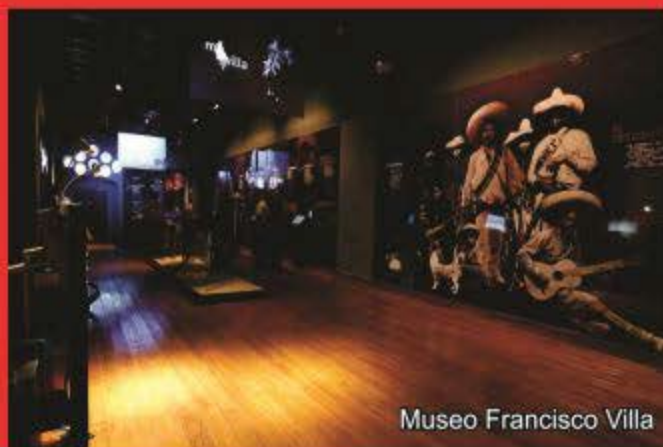
Museo Francisco Villa

En Gómez Palacio, se realizaron importantes obras viales; como la salida a el Libramiento Periférico Ejército Mexicano, el bulevar Miguel Alemán, -con paso superior 1140 y la avenida